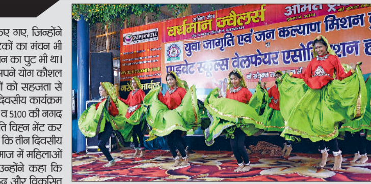
भिवानी। हरियाणवी संस्कृति का संगम कार्यक्रम के दौरान सांस्कृतिक कार्यक्रमों की प्रस्तुती देते हुए।