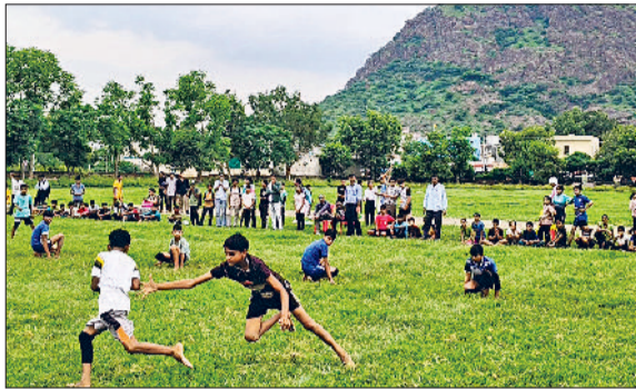
तोशाम। खो खो खेल में अंक हासिल करने का प्रयास व प्रतियोगिता के कव्ची मैच में अंक लेने का प्रयास करते हुए।