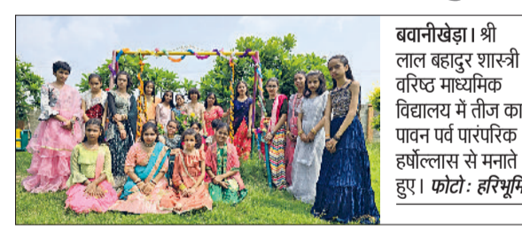
भवानीखेड़ा। श्री लाल बहादुर शास्त्री वरिष्ठ माध्यमिक विद्यालय में तीज का पावन पर्व पारंपरिक हर्षोल्लास से मनाते हुए।

श्री लाल बहादुर शास्त्री वरिष्ठ माध्यमिक विद्यालय में तीज का पावन पर्व पारंपरिक हर्षोल्लास एवं सांस्कृतिक उमंग के साथ मनाया गया। इस अवसर पर विद्यालय में विशेष कार्यक्रम का आयोजन किया गया, जिसमें छात्र-छात्राओं ने बह-चढ़कर भाग लिया। कार्यक्रम की शुरुआत सरस्वती वंदना के साथ की गई, जिसके बाद विभिन्न सांस्कृतिक प्रस्तुतियां हुईं। रंग-बिरंगी पारंपरिक वेशभूषा में सजी