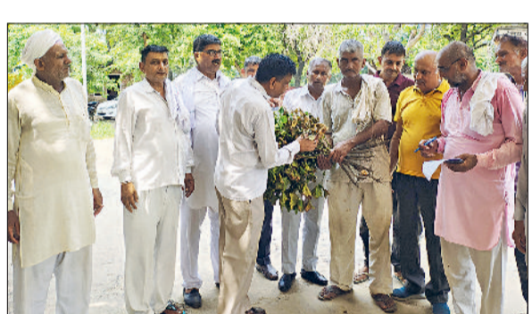
भिवानी। ज्ञापन के दौरान बर्बाद फसल दिखाते हुए।

बवानी खेड़ा व आस पास के क्षेत्र में, जलभराव के कारण किसानों की फसलें तबाह हो गई हैं, जिस को लेकर तबाह हुई फसलों के मुआवजे की मांग को लेकर किसान सभा बवानी खेड़ा व हरियाणा जागृति मोर्चा एवं कस्बा के किसानों ने तहसील बवानी खेड़ा के माध्यम से मुख्यमंत्री को ज्ञापन सौंप उन्होंने जल्द से जल्द पानी निकालने और उचित मुआवजा देने की अपील किया है। कस्बा बवानी खेड़ा में खेतों में पानी भरा हुआ है, जिससे धान, बाजरा, ज्वार और कपास की