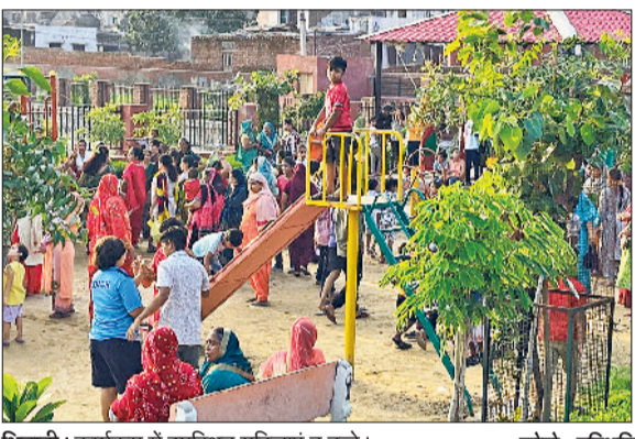
भिवानी। कार्यक्रम में उपस्थित महिलाएं व बच्चे।