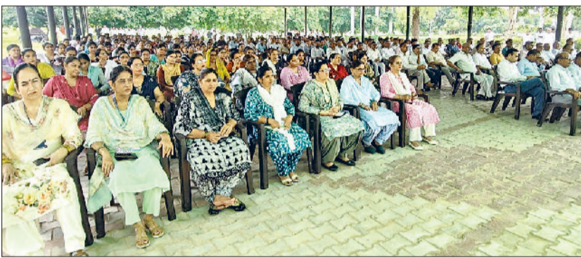
भिवानी। शिक्षा बोर्ड परिसर में अधिकारियों को एचटे की परीक्षा को लेकर दिशा निर्देश देते हुए।

बोर्ड उपाध्यक्ष ने सभी अधिकारियों और कर्मचारियों को निर्देश देते हुए कहा कि वे परीक्षा के