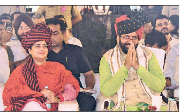
भिवानी। आयोजित कार्यक्रम में सीएम नायाब सिंह सैनी के साथ मंत्री श्रुति चौधरी।

महिला एवं बाल विकास मंत्री श्रुति चौधरी ने सोमवार को अंबाला में आयोजित प्रदेश स्तरीय हरियाली तीज महोत्सव कार्यक्रम में शिरकत की। उन्होंने वहां पर अपने संबोधन के माध्यम से विभाग द्वारा महिलाओं के उत्थान एवं खुशहाली के लिए चलाई जा रही योजनाओं पर विस्तार से प्रकाश डाला। कार्यक्रम में मुख्यमंत्री शानाब सिंह सैनी मुख्य अतिथि रहे। चौधरी ने